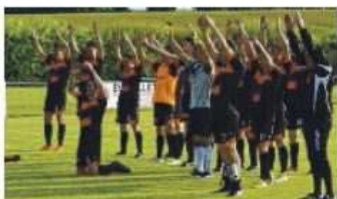
Clap de fin et clapping...