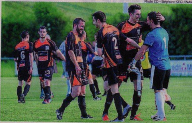
Echiré, hier. Les Echiréens se congratulent, le maintien est dans la poche.

Echiré termine la saison sur une victoire et assure un maintien inespéré il y a quelques mois.